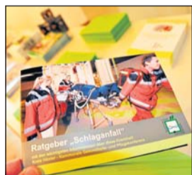
Zu wichtigen Themenfelder liegen Broschüren aus – so wie der Ratgeber »Schlaganfall«.