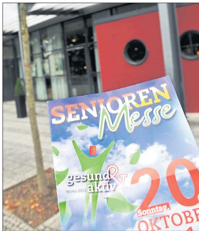
Die Seniorenmesse lockt an diesem Sonntag, 20. Oktober, von 10 bis 18 Uhr in die Höxteraner Stadthalle.